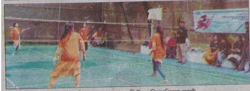
প্রিমিয়ার ইউনিভার্সিটি গণিত বিভাগের ওমেঙ্গ ব্যাডমিন্টন প্রতিযোগিতার লড়াই

মুজিববর্ষে দেশসেরা আঞ্চলিকের স্বীকৃতিপ্রাপ্ত রেজিঃ নম্বর-চ-৮৯।। ৩৮তম বর্ষ ২৯১তম সংখ্যা।। ২৭ অগ্রহায়ণ ১৪৩০ বঙ্গাব্দ।। ২৭ জমাদিউল আউয়াল ১৪৪৫ হিজরি।। Tuesday 12 December 2023।। ৮ পৃষ্ঠার মূল্য ৭ টাকা www.dainikpurbokone.net www.edainikpurbokone.net f/DailyPurbokone t/DailyPurbokone